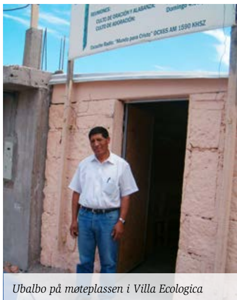
Ubalbo på møteplassen i Villa Ecologica